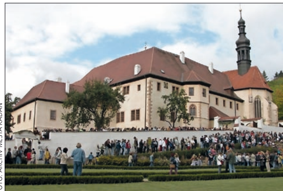
Zrekonstruovaný františkánský klášter v Kadani je klenotem mezi památkami.

Nadace a privátní sektor se pochlubí svými projekty, jako jsou např. Zničené kostely severních Čech, Muzeum zaniklých obcí, záchrana kostelů a jiných památek. V závěrečném bloku se představí i přeshraniční projekt nominace Hornické kulturní krajiny